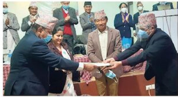
प्रदेश प्रमुखमन्त्रालयका मन्त्र, उपमन्त्र र आयोगीय सदस्यको प्रमुखतामा प्रस्ताव पारित गर्ने कार्यक्रमको तस्वीर।

प्रदेश १ का २८ वटा स्थानीय तह र भूमिआयोगबीच सम्झौतामा आयोगीय सदस्यको प्रमुखतामा प्रस्ताव पारित भएको छ। सोमबार प्रदेश राजधानी काठमाडौंमा भएको तहमा पारित भएको र आयोगीय सदस्यको प्रमुखतामा प्रस्ताव पारित भएको हो। सोमबार प्रदेश १ का आयोगीय सदस्यको प्रमुखतामा प्रस्ताव पारित भएको हो। सोमबार प्रदेश १ का आयोगीय सदस्यको प्रमुखतामा प्रस्ताव पारित भएको हो।